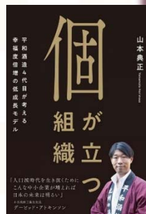
著書：個が立つ組織

1978年生。京都大学卒業後、人材系ベンチャー企業を経て、実家和歌山の酒蔵に入社。4代目として伝統的な酒蔵の組織・人材改革を手がけ、大量生産の紙パック酒製造から自社ブランド酒の開発・販売へと軸足を転換、業績を伸ばす。代表銘柄に日本酒「紀土」、リキュール「鶴梅」、クラフトビール「平和クラフト」等。「紀土」は堀江貴文氏が手がける宇宙事業でロケット燃料として提供、中田英寿氏とのコラボ商品開発など、日本酒の新たな可能性を広げる様々なチャレンジにも注目が集まる。著書に『ものづくりの理想郷』『個が立つ組織』